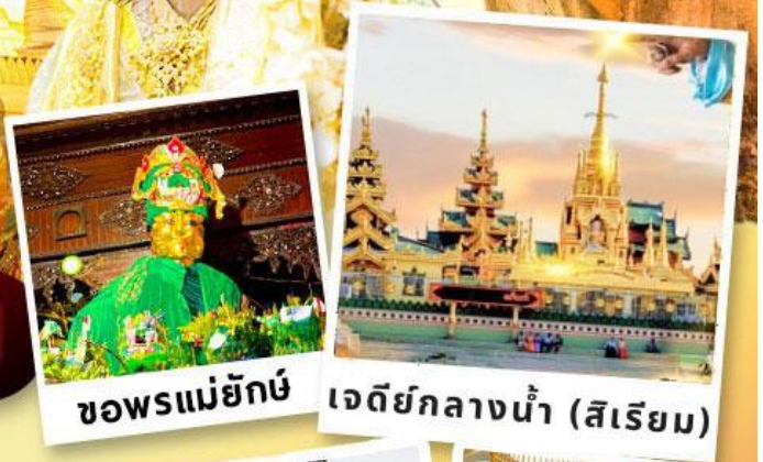
ซอพรแม่ยักย์